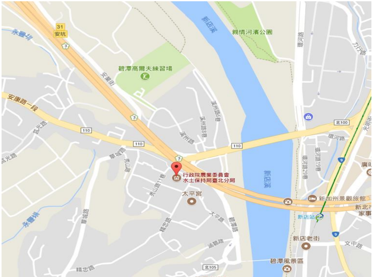
圖1 臺北分局位置圖