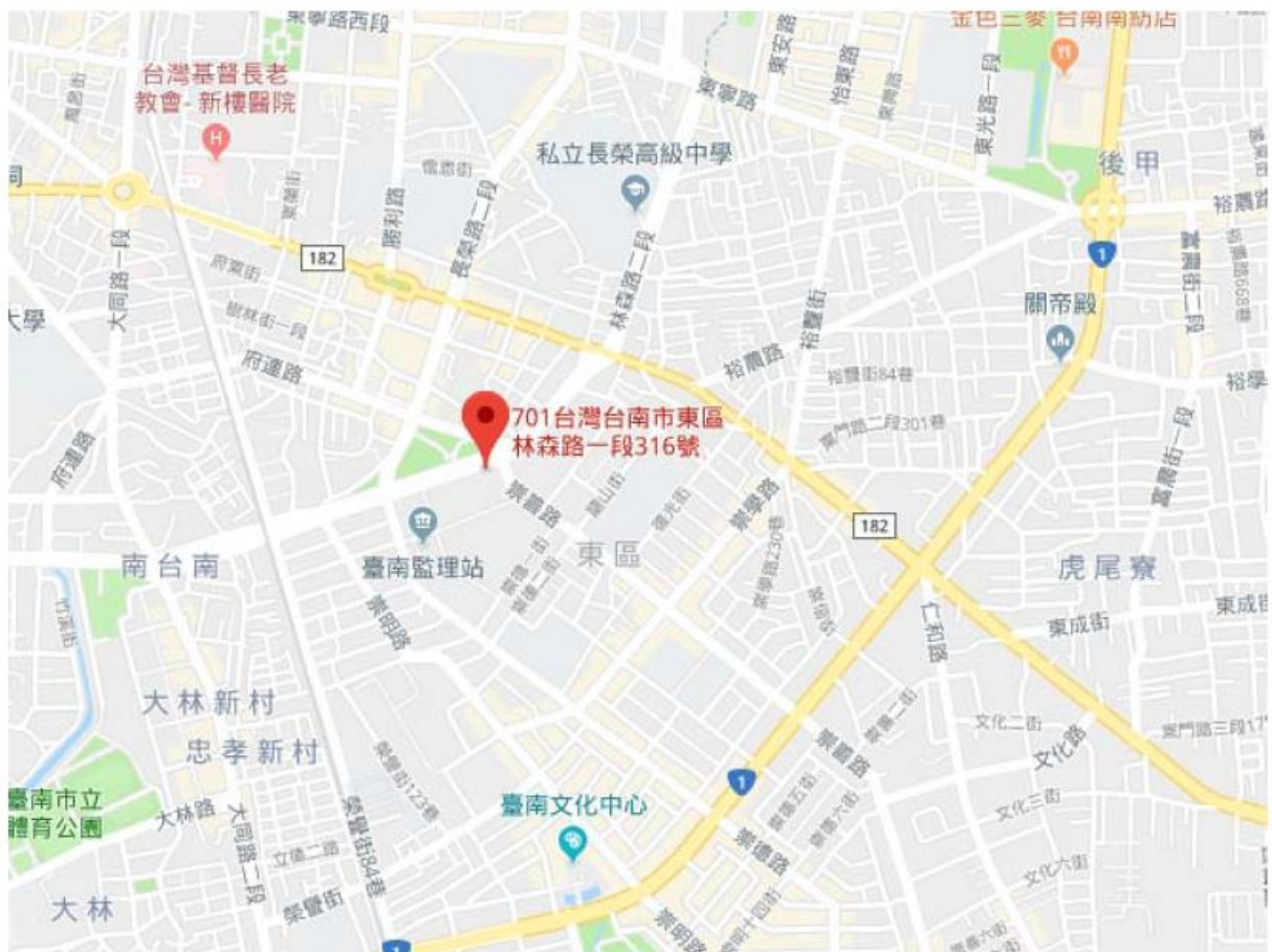
圖3 臺南分局位置圖